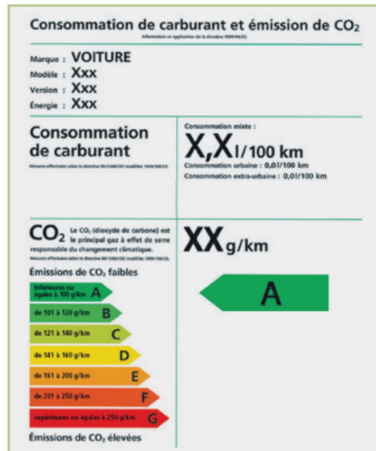
Exemple d'une étiquette énergie/CO 2

Le principe, fondé sur les émissions de CO 2 par km parcouru, est simple : il vise à récompenser, via un bonus, les acquéreurs de voitures neuves